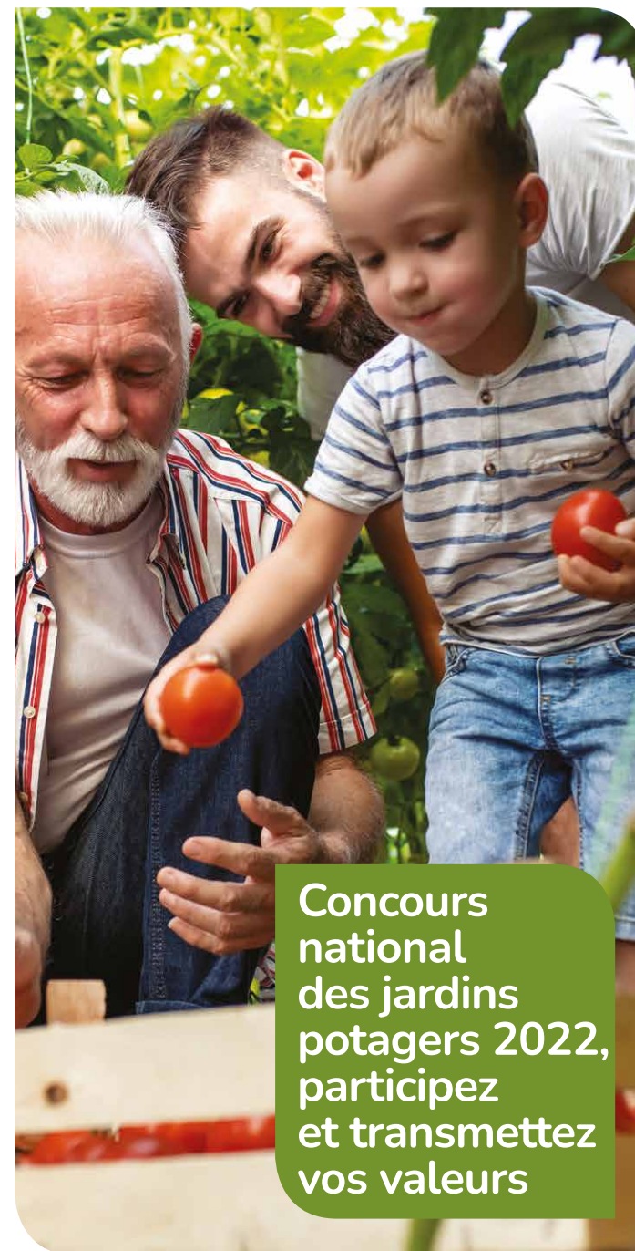
ML Lancelu

Tous les lauréats sont conviés à la cérémonie de remise des prix qui se déroule le premier mercredi du mois de décembre à la SNHF, 84 rue de Grenelle à Paris. C'est à cette occasion que le palmarès est dévoilé devant les journalistes. Il s'agit d'un grand moment de convivialité, de partage et d'échange entre jardiniers passionnés.