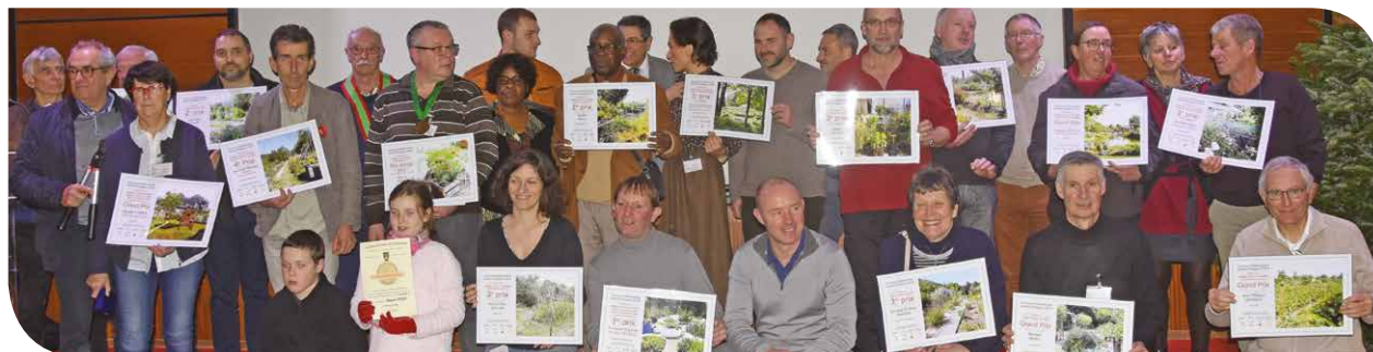
Remise des prix en décembre 2020

Dans la catégorie 4, l'Association pour le Respect de l'Homme et de la Nature pourra décerner la médaille de Chevalier de l'Ordre National de Romarin à un ou plusieurs lauréats.